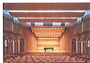
会場:神戸市産業振興センター3Fハーバーホール